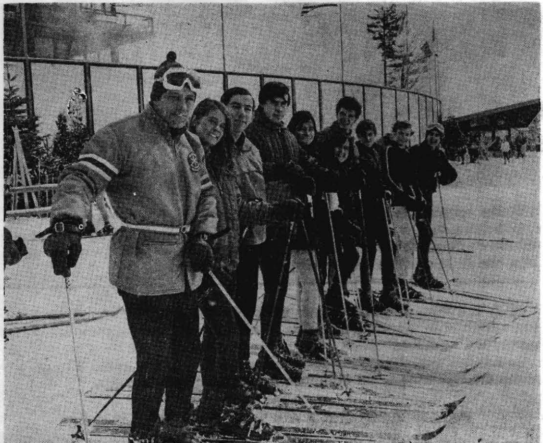
ESQUIADORES CHILENOS EN ESTADOS UNIDOS.— Un grupo de "Promesas de la Federación Chilena" entrenando en el centro de ski de "Mount Snow Valley", en Vermont.