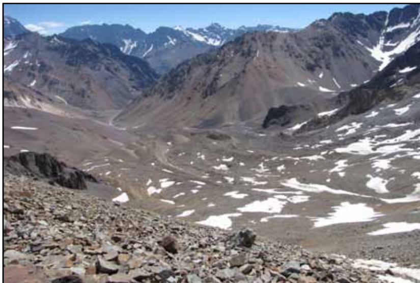
FIGURA 12.6 Arriba: Vista al oeste desde proximidades del Po. de los Gemelos.

Esta es una versión gratuita, pero si quiere utilizar cualquier parte de la misma, texto, croquis, fotos, debe citar la fuente. Si desea un ejemplar en papel solicítelo en: glaucomu@yahoo.com.ar