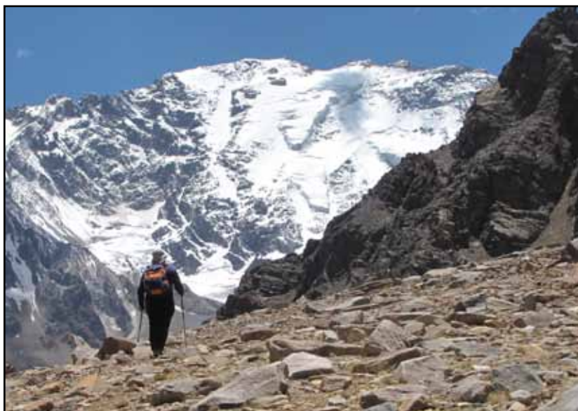
Los Hielos Olvidados

Se continúe por la huella minera o por el curso del arroyo, el ascenso por el Cajón de Navarro es mas cómodo de lo que aparenta. Cientos de metros arriba se aborda un amable llano donde el valle se divide.