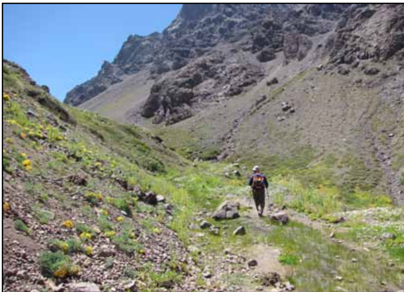
FIGURA 12.1 Arriba: como todo valle colgado, superado el escalón inicial el Estero Navarro tiene mas amabilidad.

Esta es una versión gratuita, pero si quiere utilizar cualquier parte de la misma, texto, croquis, fotos, debe citar la fuente. Si desea un ejemplar en papel solicítelo en: glaucomu@yahoo.com.ar