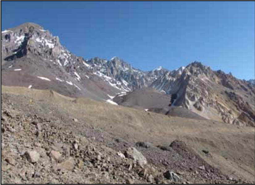
FIGURA 12.3 Arriba: Vista Norte – Sur del sitio donde el estero Navarro gira hacia el norte. De izquierda a derecha los cerros: Gustavo, Río Blanco, León Blanco y El Yeso. Obsérvense en primer plano las colinas alineadas, y atrás los frentes de glaciares de escombros que pueblan el vallecito N/D El Yeso.

Abajo: La entrada al Cajón de Navarro y Co. Punta de Cuchillo. Observar las acumulaciones de material suelto.