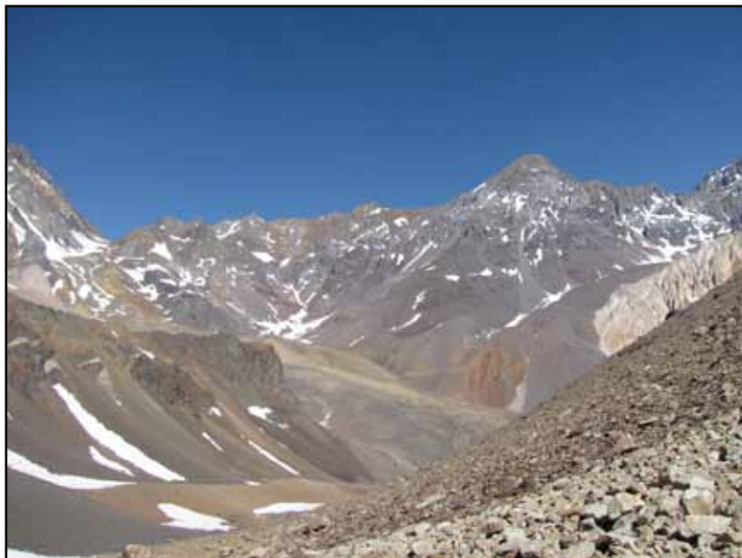
FIGURA 12.7 Vistas del horizonte sur en diferentes momentos de la subida hacia el Po. Navarro. Arriba, Estribaciones de la Cara SO de los Gemelos, Po. de los Gemelos, Co. H. Barrera, Co. Gustavo, estribaciones del Co. Río Blanco.

Abajo: Ya en lo alto, ocultas las inmediaciones del Po. de los Gemelo, se observan de izquierda a derecha: Co. Río Blanco, Co. León Blanco, (debajo Co. El Yeso), Co. León Negro, Co. Mono Negro, Nevado Juncal.