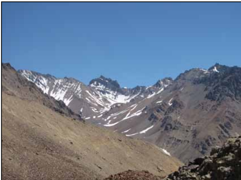
FIGURA 12.4 Arriba: La rama sur del Cajón de Navarro con el Co. Parque Andino de 4.584m Abajo: Desde el Po. 4.041 N/D "El Yeso" se observa la rama este del Cajón con sus Glaciares de Escombros. Atrás la rama Sursureste. Al fondo Mono Negro.

Esta es una versión gratuita, pero si quiere utilizar cualquier parte de la misma, texto, fotos, croquis, fotos, debe citar la fuente. Si desea un ejemplar en papel solicítelo en: glaucomu@yahoo.com.ar