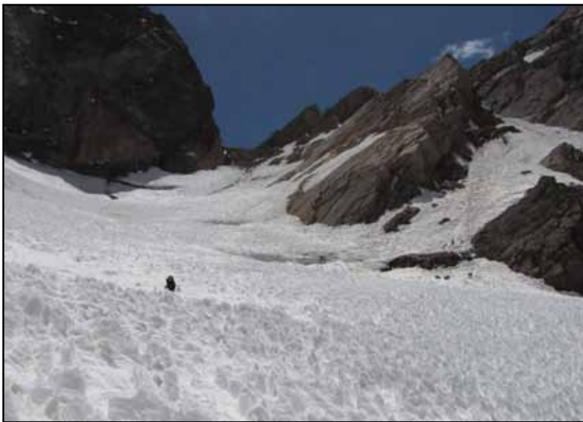
FIGURA 12.9 Arriba, la cabecera del Glaciar Navarro con el Portezuelo al fondo.

Esta es una versión gratuita, pero si quiere utilizar cualquier parte de la misma, texto, croquis, fotos, debe citar la fuente. Si desea un ejemplar en papel solicítelo en: glaucomu@yahoo.com.ar