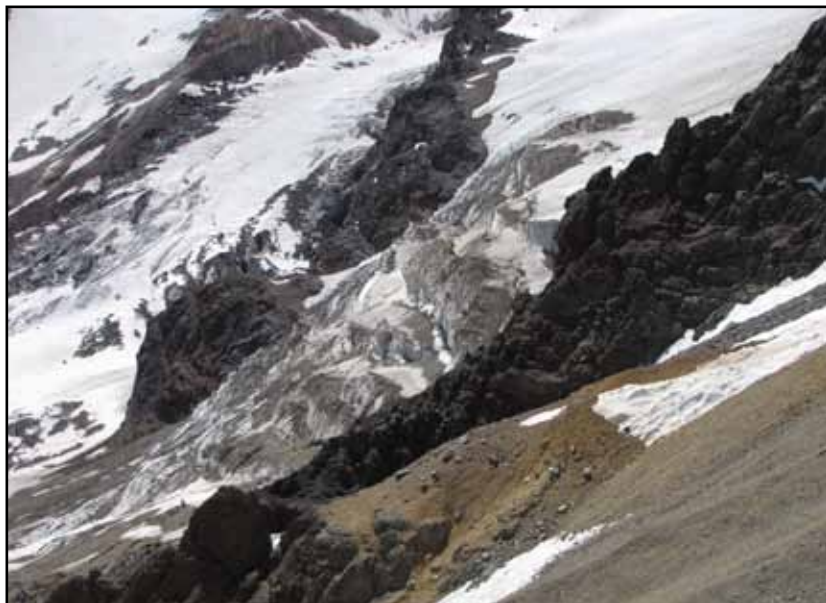
FIGURA 12.12 El comienzo (arriba) y el final (abajo) de la escalada de la cara suroeste de los Gemelos. El Glaciar de la foto inferior, “serac superior”, como el de las caras sur del Pico Bonito y el Cerro Río Blanco, es una forma residual y rudimentaria que podría pertenecer a lo que se ha denominado como “glaciares de pared”. Quien encara la escalada de una ruta debería estar en condiciones de reconocer el aspecto de hielos “peligrosos” como el del lateral derecho del glaciar