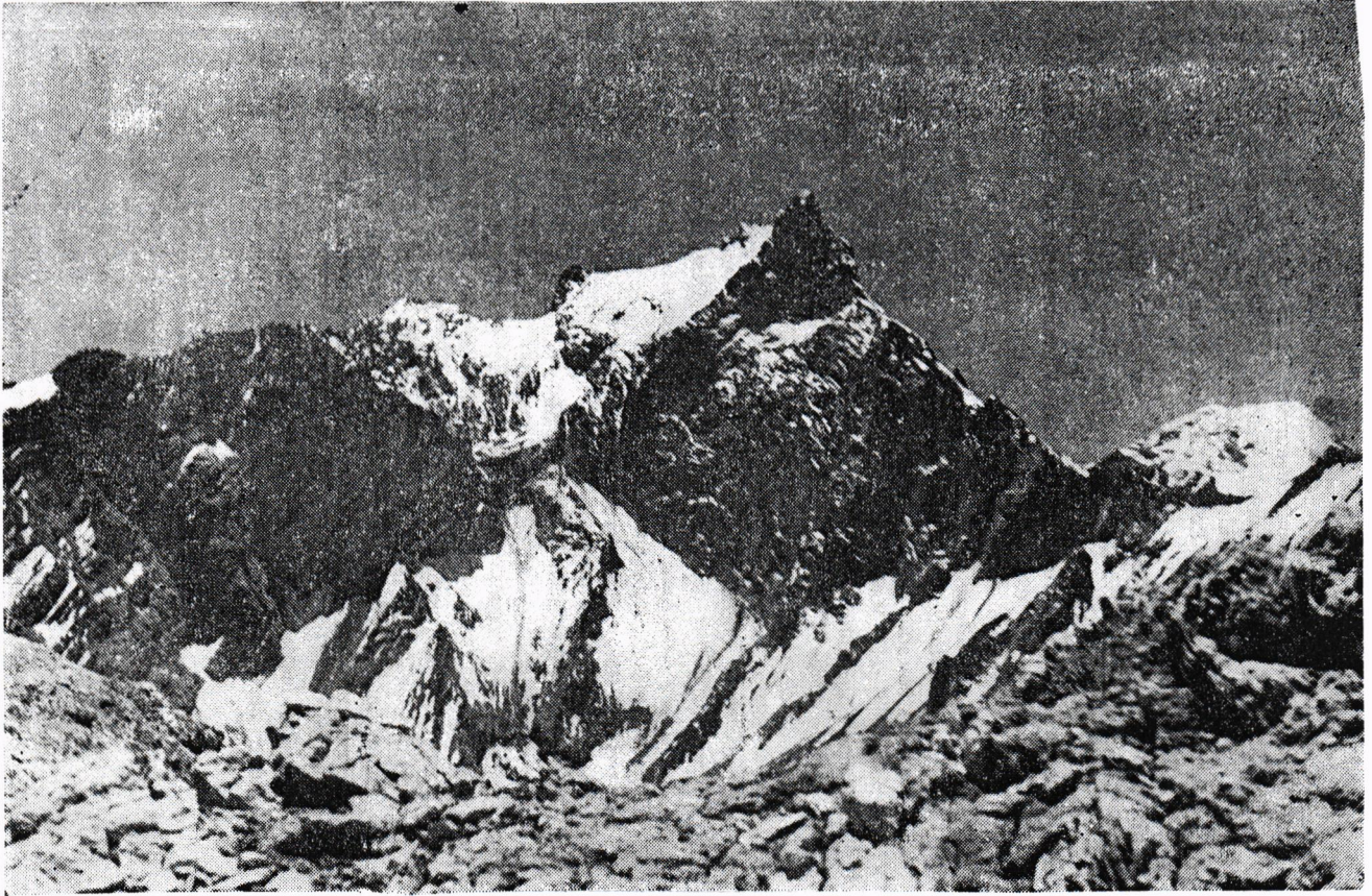
Cerro Chimbote visto desde el Suroeste, mostrando la Pared del . Quebrado. A la izquierda la arista cumbreera Norte y a la derecha, la arista Sur.