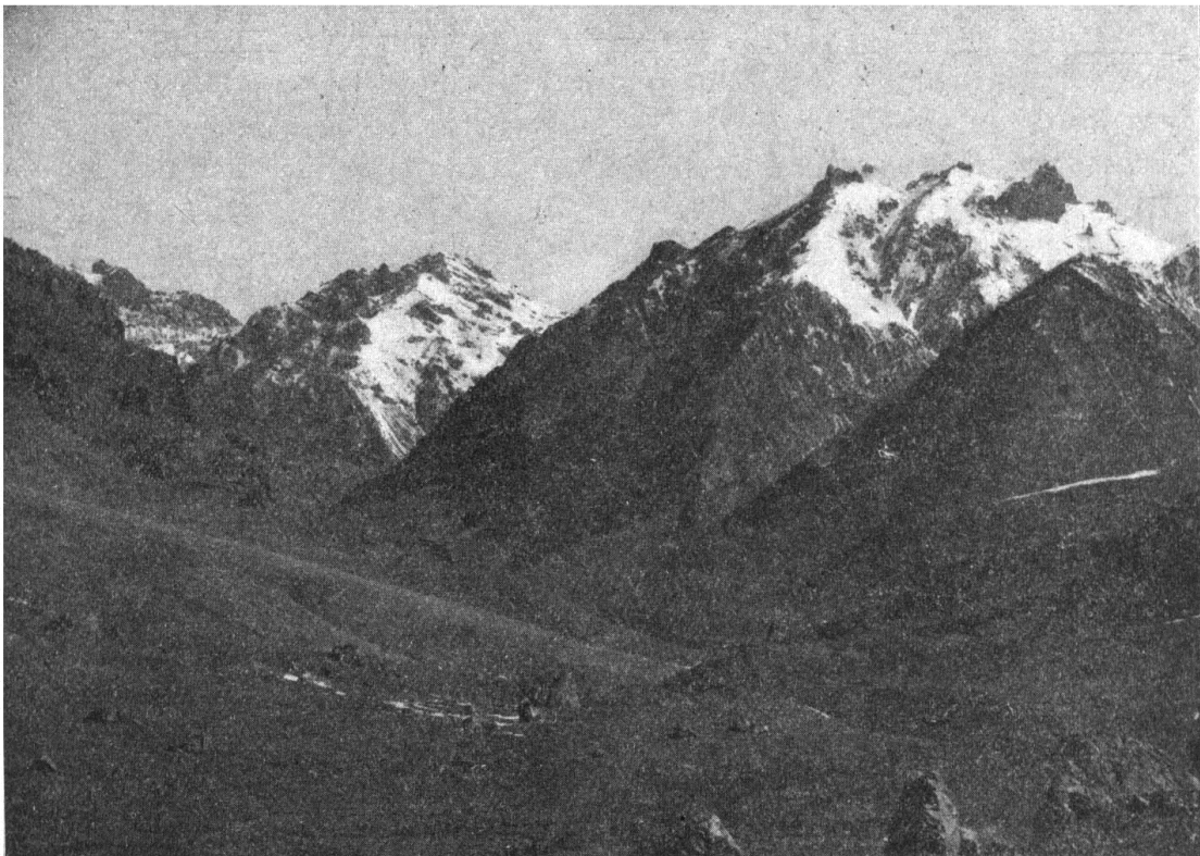
5.- Cerro "Sin Nombre" y Cerro De Los Dedos (Desde el Valle Horcones posterior)