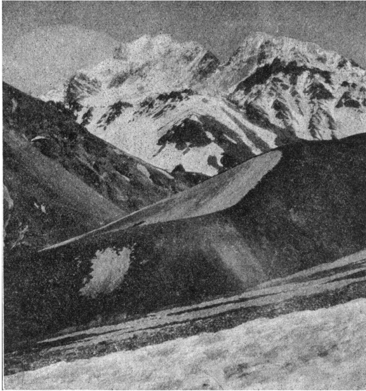
6.- El Cerro Tolosa y el Cerro "Sin Nombre" (Desde el valle Horcones posterior)