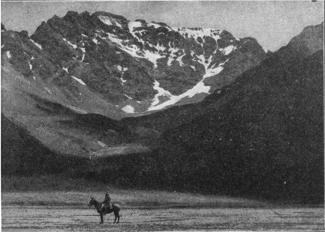
4.- El Cerro Tolosa (Desde el Valle Horcones)