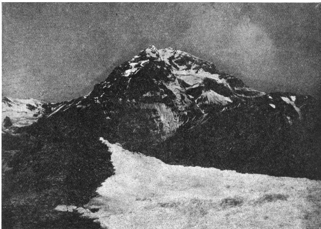
7.- El Aconcagua (Visto desde la cumbre del Cerro Tolosa)